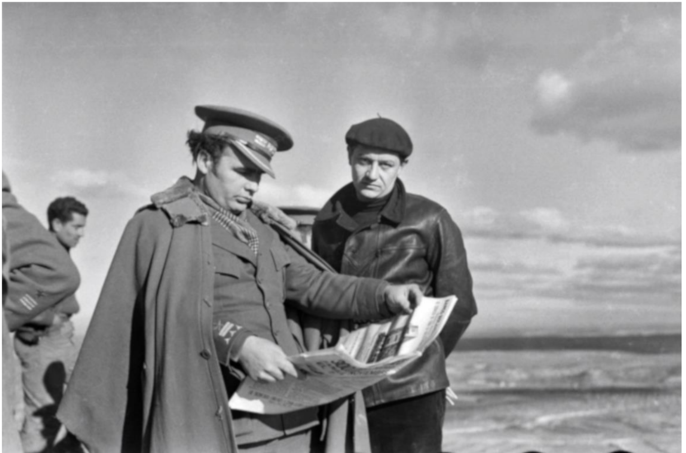
Enrique Lister y André Malraux, en el frente catalán.

Sin embargo, la ofensiva republicana permitió «tomar la iniciativa y mantenerla desde que empezaron las operaciones hasta que finalizaron» ( Ibidem ). Lister también señala que esta batalla «mejoró de manera manifiesta la situación política y militar de la República y pudo haber sido un punto de partida para cambiar la marcha de la guerra» ( Ibidem ), aunque las negligencias de algunos jefes republicanos facilitaron la concentración de fuerzas franquistas y marcaron el destino de la derrota republicana (Lister: 1977,361).