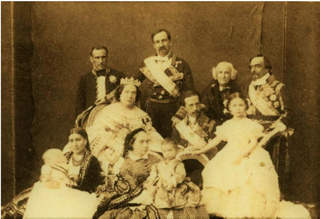
Ilustración 2 Familia Real Española. Museo Nacional del Romanticismo .Autor/a Laurent y Mirnier, Juan

Será preciso obviar unos primeros y tristes acontecimientos que les suceden a Juana Posse y a sus dos pequeños al llegar a Madrid después de un pesado viaje desde la lejana, periférica y provinciana villa de Ferrol.