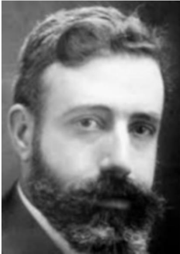
Ilustración 3 Pablo Iglesias Posse.

La salud de Paulino se había quebrado por la carencia de una alimentación adecuada, por tal motivo fue ingresado en dos ocasiones en la enfermería del centro. En la segunda y última vio las estrellas.