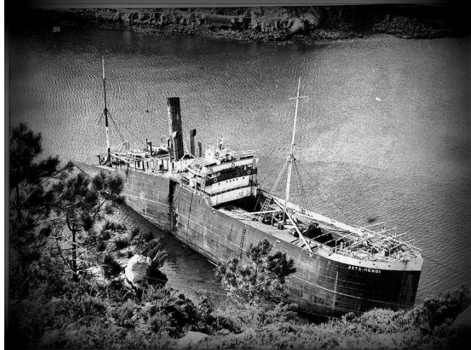
Vapor Jata Mendi .